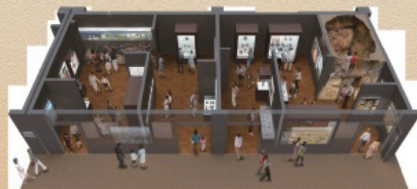
展示室イメージ図