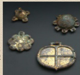
竹原古墳出土遺物