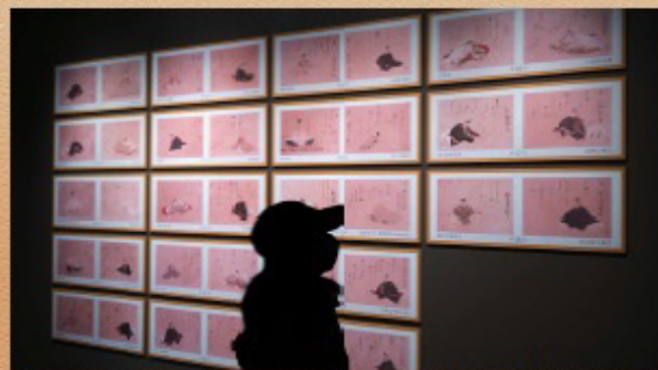
若宮三十六歌仙絵複製パネル